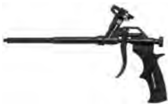
PUP M4 BLACK Металлический пистолет с тефлоном