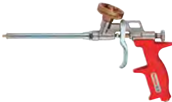
PUP M 3