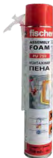
PU 750 Монтажная полиуретановая пена летняя ручная