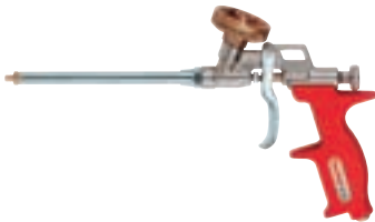
PUP M 3