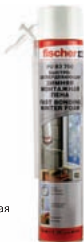
Монтажная полиуретановая пена зимняя ручная