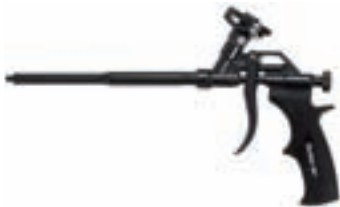
PUP M4 BLACK Металлический пистолет с тефлоном