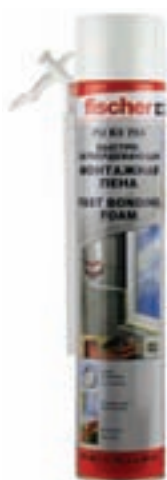
Монтажная полиуретановая пена летняя ручная